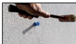
Zatlouci lamelovou hmoždinku až nadoraz.