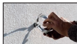
Našroubovat objímku svodu.