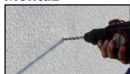
Vyvrtat otvor \varnothing 10mm skrz omítnutou zateplenou fasádu.