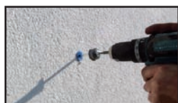
Zašroubovat vrut s krytkou pomocí bitu Torx 25.