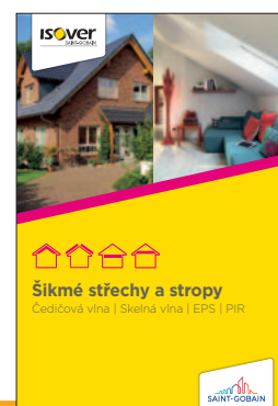
Detailní popis aplikace výrobku je uveden v katalogu ISOVER Šikmé střechy a stropy

1. 9. 2020 Uvedené informace jsou platné v době vydání technického listu. Výrobce si vyhrazuje právo tyto údaje měnit.