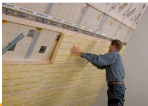
Ukázka aplikace výrobku ISOVER Multiplat 34 NT

6) FU = funkční jednotka (1 m 2 izolace o tloušťce 100 mm při započítaných fázích životního cyklu A1-A3).