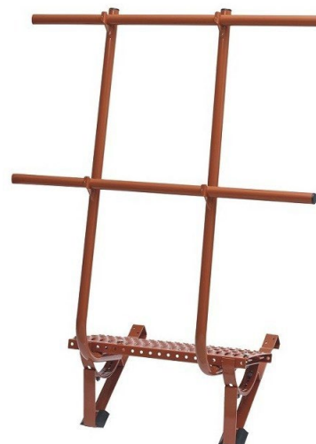
Kominická lávka SET – průběžná