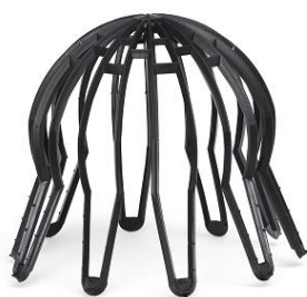
LPAČ LISTÍ STANDARD