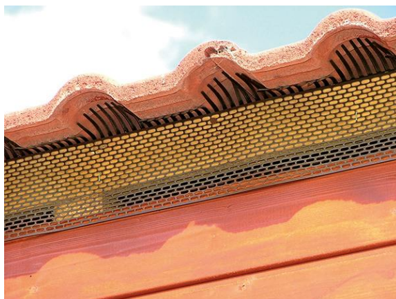
Ochranná větrací mřížka jednoduchá

Ochranná větrací mřížka se přibíjí na okapovou lať (první lať na okapové hraně) pomocí hřebíků ve vzdálenosti cca 10 – 15 cm