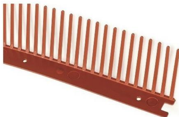
Ochranná větrací mřížka jednoduchá